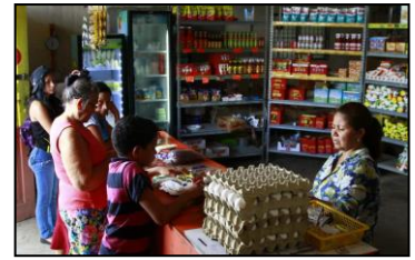
BANASUPROS en la Región 01 y demás regiones, solicitados en Gabinetes Populares, ejecutados en un 100%