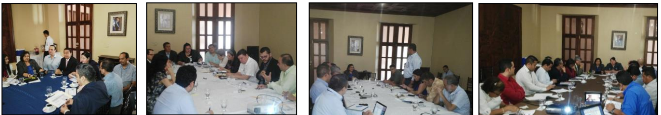
De izquierda a derecha, seguimiento Junio 2015 a Gabinetes Populares con Comisiones de la Región 02: Valles de Comayagua; Región 01: Valle de Sula; Región 03: Occidente y 14: Lempa; Región 13: Golfo de Fonseca.

En los cuatro Gabinetes Populares realizados se cuenta con ciento tres (103) proyectos a los que a la fecha se les da seguimiento. El interés que prevalece al darle seguimiento a los proyectos aprobados por el Presidente de la República en la Plenaria de los Gabinetes Populares, es que las comunidades se beneficien con su cumplimiento, por lo que además del seguimiento se verifica en el sitio el avance de cada uno, a través de la Comisión de Seguimiento de cada región como veedor del desarrollo de los proyectos ya sean estos de infraestructura o de servicios.